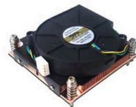
1U主动式CPU散热器(选配)