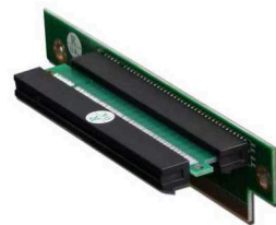
各式1U riser card转接卡(选配)